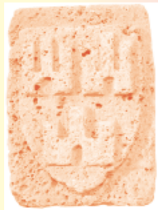
Ecu d'Hérédia conservé à Sainte-Eulalie de Cernon