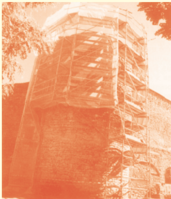
Travaux du Nord-Ouest : remparts de La Cavalerie Entrées du Larzac avec le plus grand nombre d'entrées pour le Camp médiéval.

La saison touristique 2002 a été celle du contournement de La Cavalerie par l'A75, le 26 juin très précisément. Telle une épée de Damoclès au dessus de nos têtes, cette date pouvait laisser présager le spectre de la désertification de notre site ! La RN 9 ayant retrouvé un certain calme, l'accès au village est facilité, permettant ainsi aux visiteurs jadis dissuadés par les " bouchons ", de se hasarder dans les rues du vieux village. C'est d'ailleurs ce que l'on constate au Point Accueil puisque l'on a pu constater une augmentation de la fréquentation (18 496 personnes en 2002 pour 14 430 en 2001) et une excellente participation du public aux